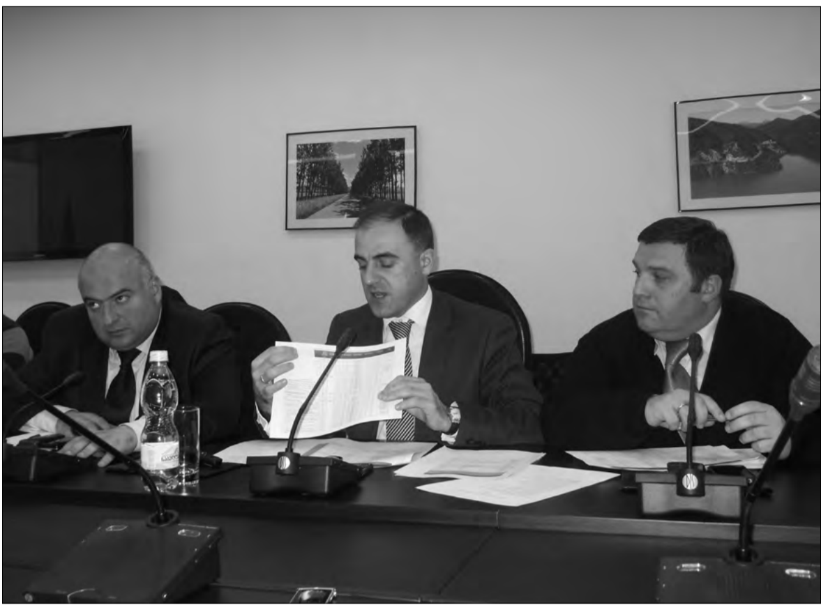
რეგიონული განვითარებისა და ინფრასტრუქტურის მინისტრი ღავით ნარმანია (ცენტრში) და მინისტრის ადგილზე იმდროინდელი შიდა რეგიონული განვითარების მინისტრი ივანე ბერიძე (მარჯვნივ) და შიდა რეგიონული განვითარების მინისტრის მოადგილე ივანე ბერიძე (მარცხნივ).

თბილისი-სენაკის საავტომობილო მაგისტრალის სურამი-ხესტაფონის 60 კილომეტრიანი მონაკვეთის მშენებლობასთან დაკავშირებით საკითხის შესწავლა მიმდინარეობს და ჯერჯერობით, კონკრეტული გადაწყვეტილება მიღებული არ არის. „ვიცი, რომ ამ მონაკვეთზე საავტომობილო მაგისტრალის მშენებლობა ძვირია და ძალიან დიდ ტექნიკურ სამუშაოებთანაა დაკავშირებული. უხეში გათვლებით, 800 მილიონი ლარია საჭირო. ამჟამად ვსწავლობთ, რომ უფრო ზუსტად ვიცოდეთ, სად რა მდგომარეობაა, სად შეიძლება გაიაროს გზამ, სად შეიძლება არსებული მონაკვეთის გაფართოება და დაახლოებით რა დაჯდება. პროექტების პროცესი მოგვცემს ზუსტი გადაწყვეტილების მიღების საშუალებას.“ „აღნიშნა საქართველოს რეგიონული განვითარებისა და ინფრასტრუქტურის მინისტრმა ღავით ნარმანიამ რეგიონული მედიის წარმომადგენლებთან შეხვედრაზე. ჩემს შეკითხვაზე, ვერაულოებენ თუ არა ალტერნატივად ფონის შემოვლითი გზის განხილვას, მან განაცხადა: „ამას, ჯერჯერობით, ვერაფერს გეტყვით, ვიდრე საპროექტო შესწავლა არ დაიწყება.“